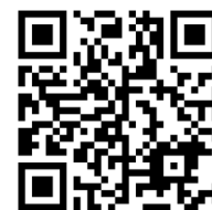
新料金プラン特設サイト

https://www.enexls.ne.jp/info/23_20230701.html