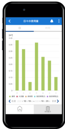
図) ガス使用量グラフ(日ごと)